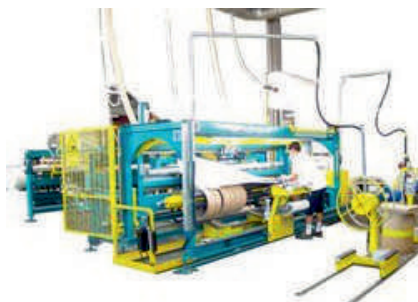
Macchina avvolgitrice di lastre in vetroresina completamente automatica di totale creazione VMC Srl.

no con tecnologia ideata da noi. Ora, comunque, stiamo realizzando una macchina per la profilatura e il taglio di laminati metallici per una importante azienda canadese (entrata in contatto con noi dopo aver visitato un nostro prodotto nel North Carolina), mentre alcuni giorni fa analoga ditta francese è venuta a trovarci, qui, a Portomaggiore”. “Ho visto la macchina in costruzione per il Canada, è enorme, come ci arriva fin là?”